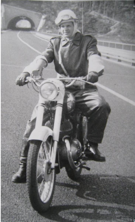
Miličnik pred predorom Ljubno, ok. 1965

V spomin na nekoč novo cesto (ok. 1965), danes pa le še del avtoceste skozi našo občino.