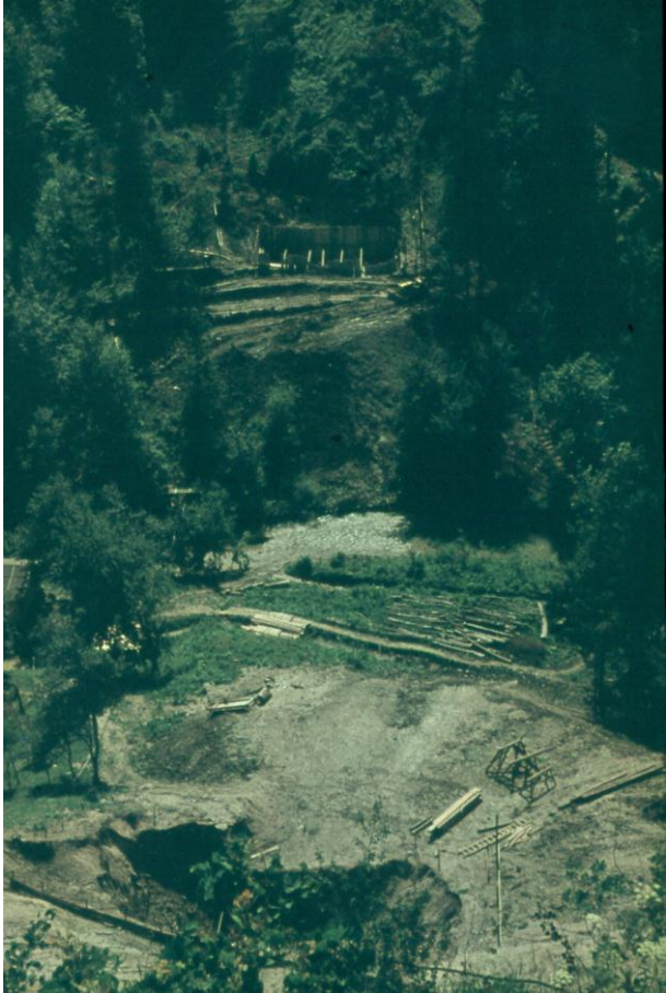
Kopanje temeljev za stebre viadukta Peračica, 1965