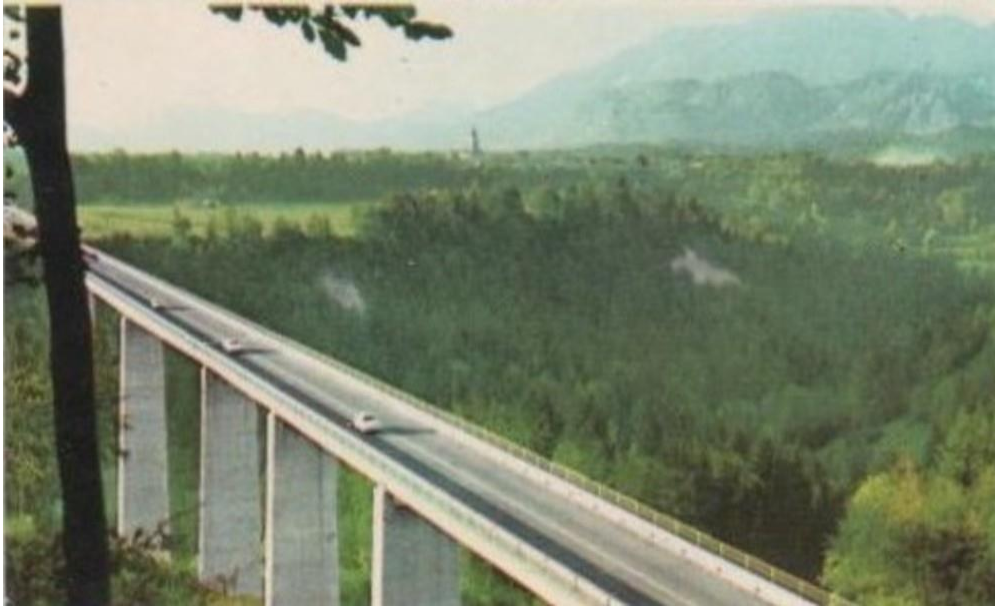
Viadukt Peračica, ok. 1965