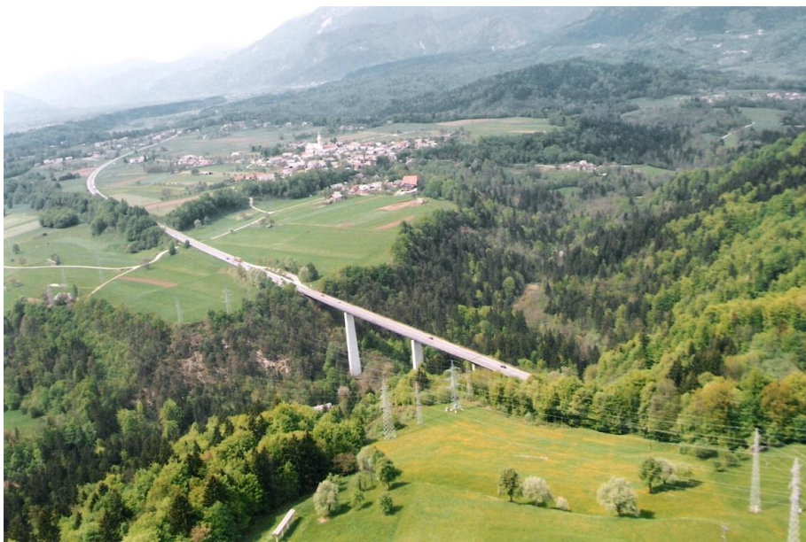
Viadukt Peračica (na desni Brezje), 1996

Prvič objavljeno: 18. 11. 2011 Zadnjič objavljeno: 01. 12. 2011