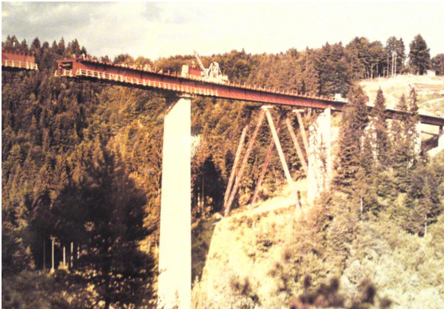
Gradnja viadukta Peračica, 1966